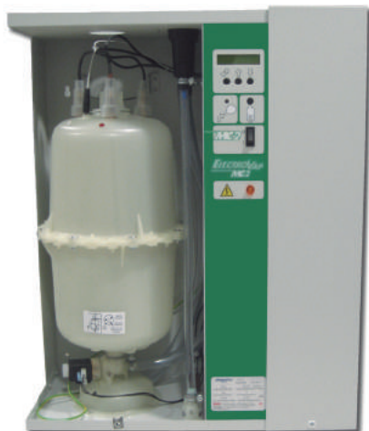
► HUMIDIFICADOR DEVATEC ELMC