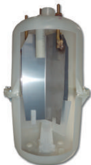
► CILINDRO DE VAPOR DESECHABLE o REUTILIZABLE (opcional)