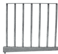
Sistema de difusión múltiple MULTISTEAM